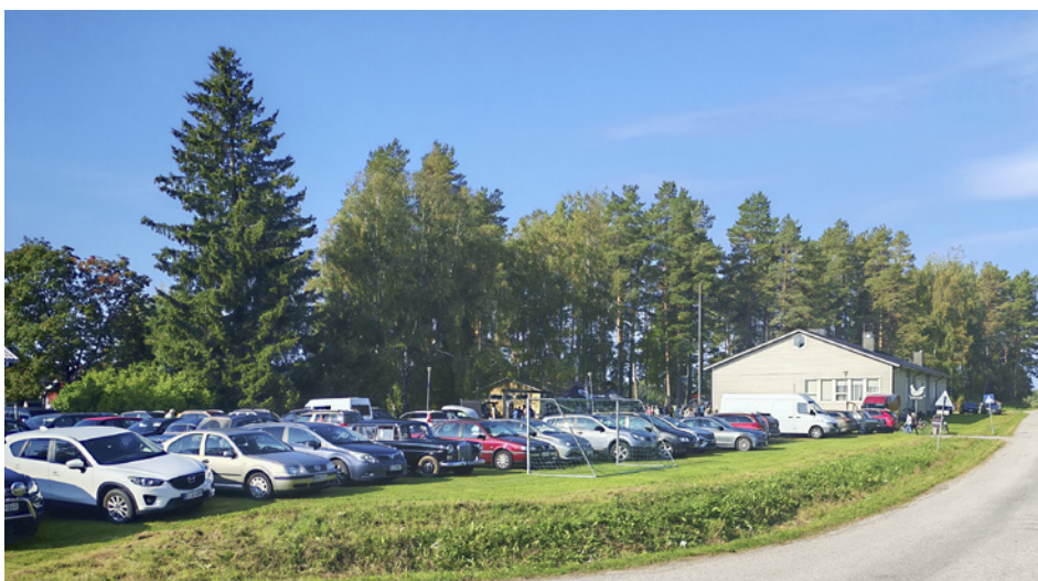
Kukonkosken kylätalon parkkipaikka täyttyi heti aamusta alkaen.