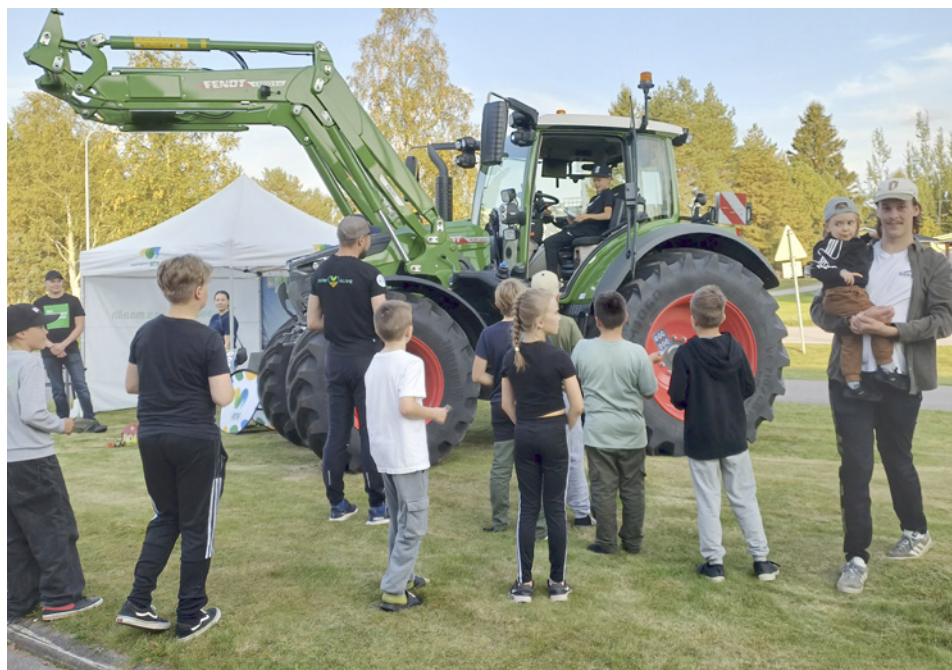
Suurikokoinen ja nykyaikainen traktori kiinnosti erityisesti lapsia.