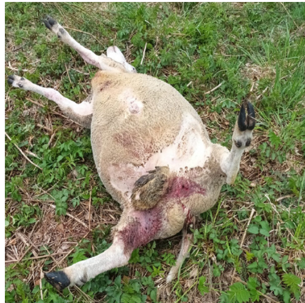
Sudet ovat tappaneet Tuikkasten tilalta kaikki viisi siitospässiä ja ahdistelleet myös muuta karjaa aivan pihapiirissä. Perjantaina tuli kaatolupapäätös.

- Jahtimiehet tulivat heti passiin, nyt ei ole enää rosvoilla pihalle asiaa, Juho toteaa tyytyväisenä.