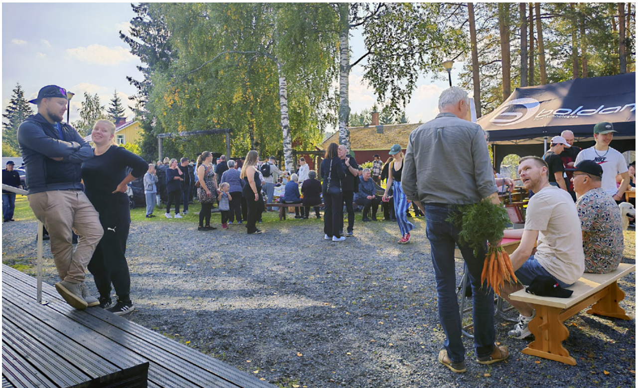
Sää suosi Kukonkylän Sadonkorjuumarkkinoita. Ohjelmassa oli muun muassa arvontaa ja lapsille toiminnallinen rata. Myyntikojuista sai ostaa muun muassa herkullisia porkkanoita.