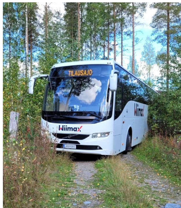
Taitavan kuskin taidot punnittiin viimeisen 300 metrin matkalla, jossa tila alkoi käydä ahtaaksi 65 hengen turistibussille.

- Jännitys tiivistyi viimeiselle 300 metrille, sillä museon pihatie on todella kapea. Meitä vastaanottamassa olleet kotiseutuyhdistyksen