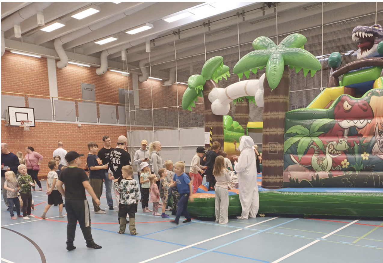
Pomppulinnaan oli koko ajan jonoa. Tapahtumassa kävi yhteensä noin 300 henkeä.

Passeja oli tehty 210 kappaletta. Ne kaikki käytettiin. Kun lasketaan mukaan vanhemmat, niin arvioitu kokonaisikäväijämäärä oli noin 300