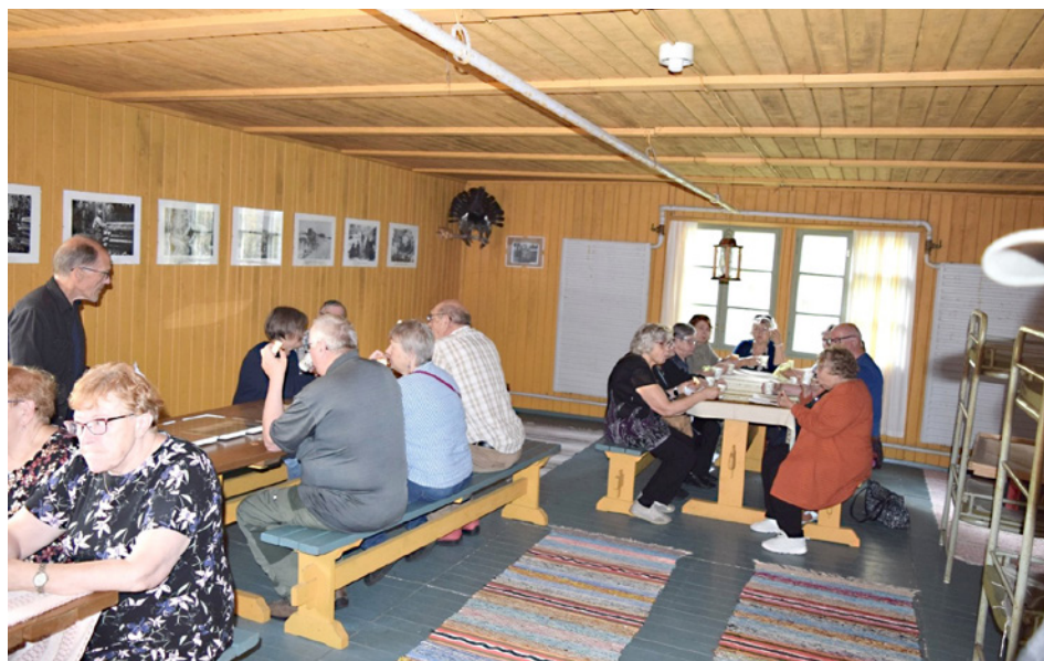
Matkalaisten kahvitauko savottakämpämuseolla.

Reisjärvellä ensimmäisenä pysähdyspaikkana oli Susisaareissa sijaitseva Hotelli Saari, jossa retkeläiset nauttivat lounaan ja tutustuivat viereiseen runokivenpuistoon. Runokivenpuistossa voi rantapolulla kävelyn ja järvimaiseman ihailun lomassa hiljentyä pohtimaan kiviin kaiverrettuja runoja